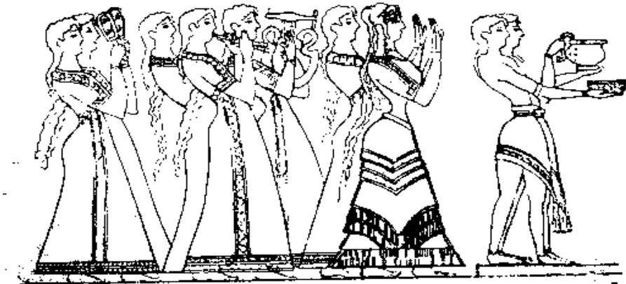
Слика 1. Део поворке која пролази “светом стазом” крито-микенских игралишта

Тек кад је пронађено ово и још нека друга игралишта, могли су потпуно да буду објашњени многобројни прикази разних сцена, које су претстављене на разним археолошким налазиштима тога доба. Тадашњи уметници су на разним фрескама, вазама и печатном камењу приказивали верске обреде, племенско-родовске свечаности и разне фискултурне елементе. Упоређивањем свих ових налаза створена је слика о свечаностима, које су се одржавале на овим игралиштима.